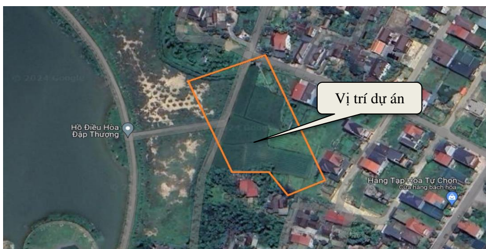
Hình 1.1. Sơ đồ vị trí khu vực thực hiện Dự án