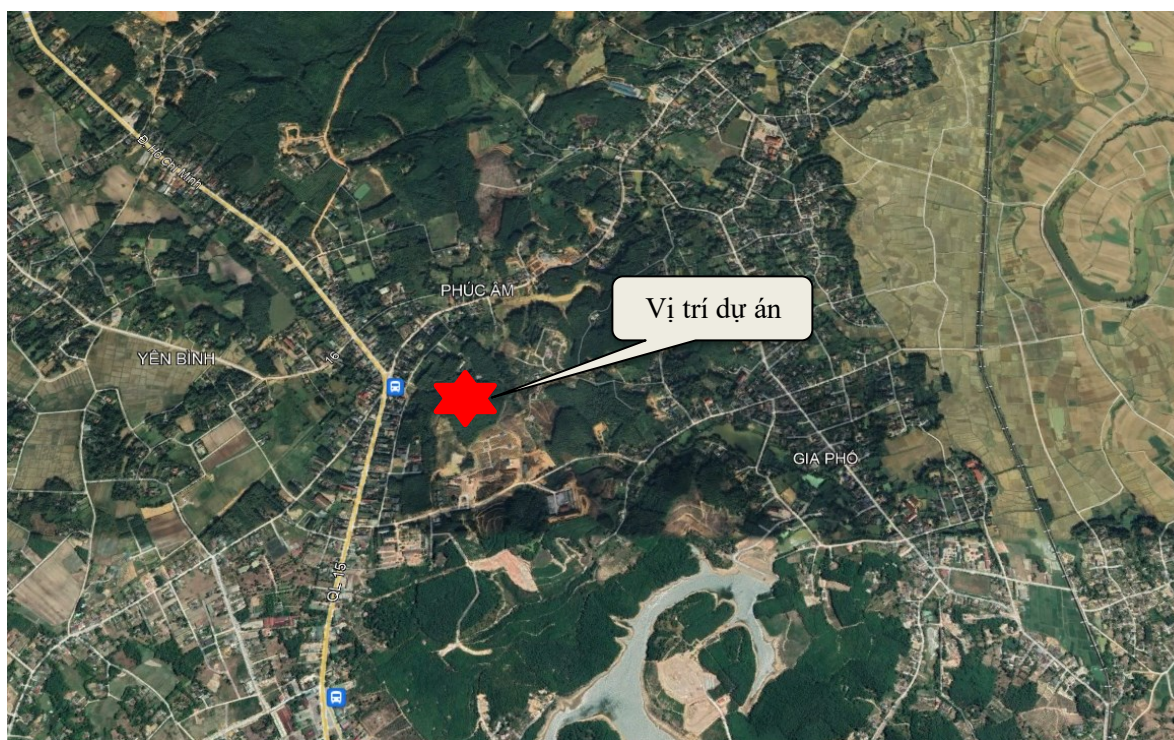
Hình 1.1. Sơ đồ vị trí khu vực thực hiện Dự án