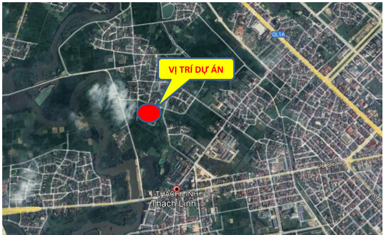
Hình 1.1. Sơ đồ vị trí khu vực thực hiện Dự án