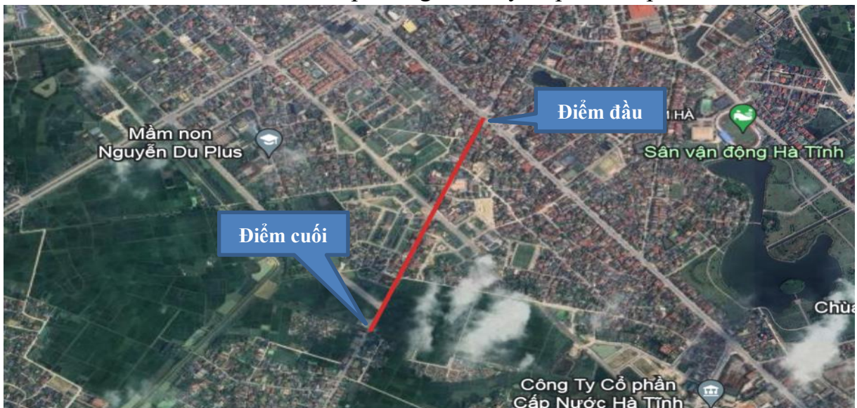
Vị trí thực hiện dự án

Địa điểm thực hiện dự án: phường Hà Huy Tập, thành phố Hà Tĩnh.