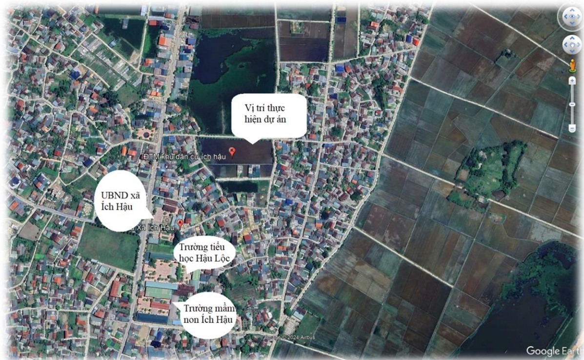
Vị trí thực hiện dự án

Dự án Đường giao thông, mương thoát nước thôn Thống Nhất, xã Ích Hậu thuộc địa bàn thôn Thống Nhất, xã Ích Hậu, huyện Lộc Hà, tỉnh Hà Tĩnh.