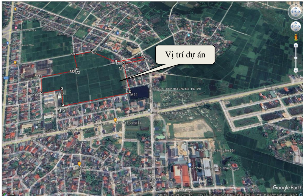
Hình 1.1. Sơ đồ vị trí khu vực thực hiện Dự án