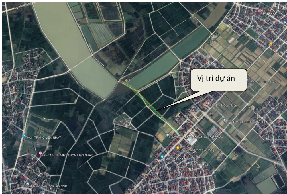
Hình 1.1. Vị trí thực hiện dự án

Vị trí khu vực thực hiện dự án thuộc xã Đồng Môn, thành phố Hà Tĩnh, tỉnh Hà Tĩnh, với chiều dài khoảng 600m, chiều rộng 15m