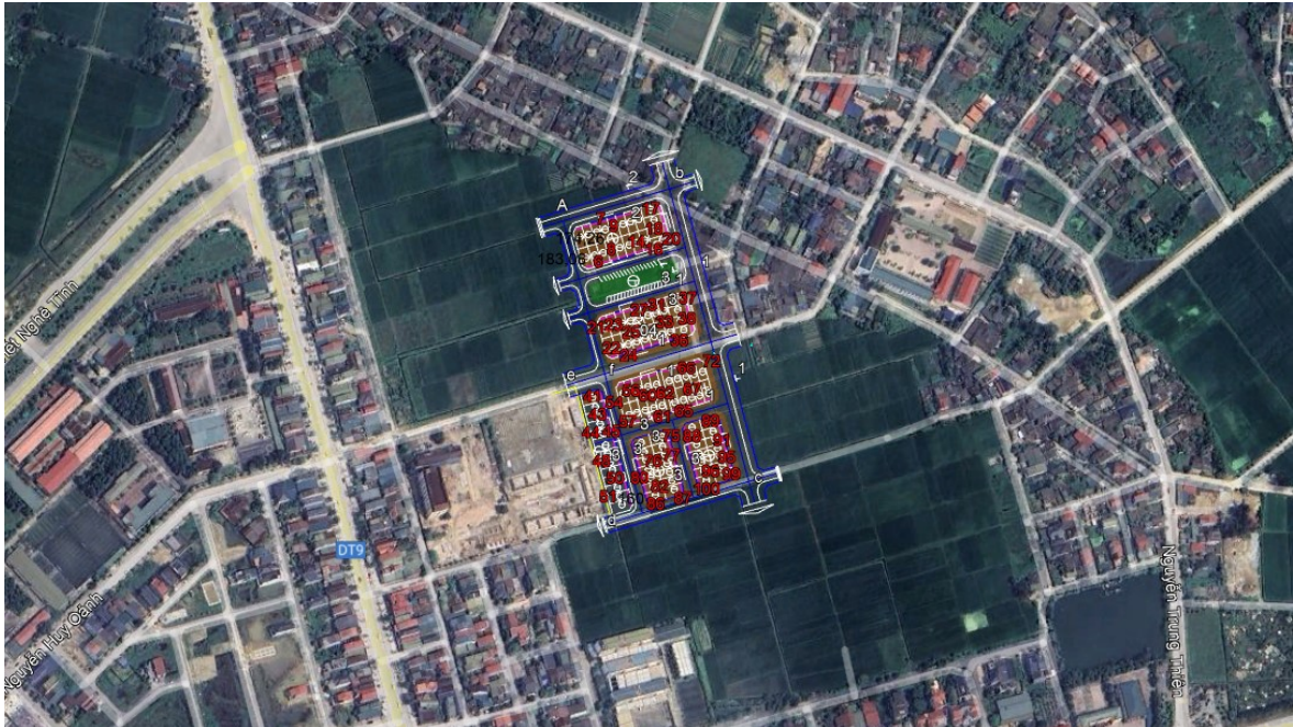
Vị trí thực hiện dự án