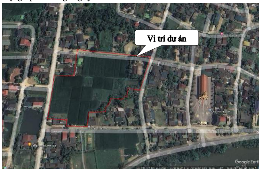
Hình 1.1. Sơ đồ vị trí khu vực thực hiện Dự án